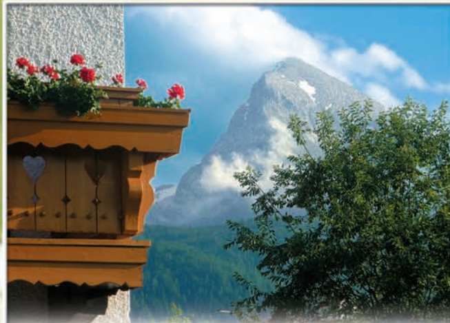
Blick von der Gartenterrasse