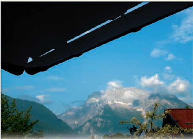
Aussicht vom Balkon

Unser Haus liegt inmitten eines der schönsten Bergpanoramen , das Sie in Bayern finden können.